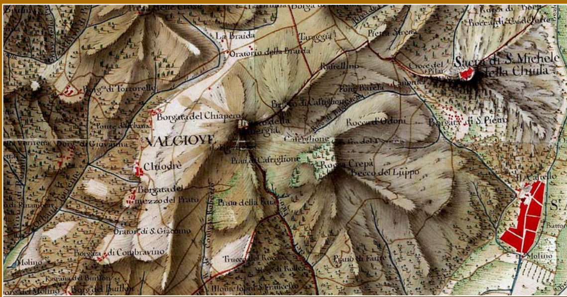
Valgioie nella "Carta topografica in misura della Valle di Susa e di quelle di Cezane e Bardonneche divisa in nove parti" (circa 1770). Archivio di Stato di Torino (Ministero per i Beni e le Attività Culturali).

Ai tempi delle dominazione longobarda Valgioie costituiva un agglomerato urbano situato più a valle di dove si trova ora, verso i Bertassi. Dalla metà del XIII sec. divenne "Vallis Judea o Judeaorum", una comunità ebraica rifugiata qui per sfuggire alle persecuzioni e che nel 1272 divenne comune autonomo, staccandosi da Avigliana. Nel 1294 Amedeo V di Savoia donò "Valle Zoja" in feudo a Guglielmo di Challant, Signore di Mongiovetto (bassa Valle d'Aosta), i cui eredi lo girarono nel 1310 al procuratore sabaudo, Giovanni Rustio di Avigliana. Dopo alterne vicende, nel luglio del 1780, Valgioie passò sotto la giurisdizione dell'Abbazia della Sacra di San Michele, ma con la soppressione dell'abbazia ritornò sotto l'Arcidiocesi di Torino. Durante il regime fascista il Comune di Valgioie fu annesso a quello di Giaveno riguadagnando infine la piena autonomia nel 1957.