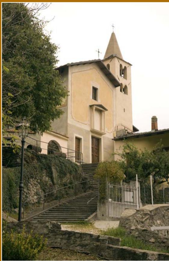
La Chiesa di San Pancrazio.

Vaie ha origini che risalgono alla Preistoria. Vicino a Pradera e Baità si trovano infatti tracce di un villaggio della tarda Età del bronzo, l'odierno Riparo Rumiano (poi divenuto una cava di gneiss).