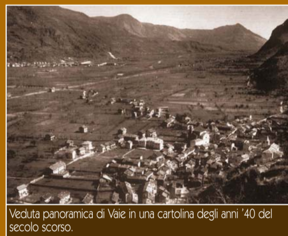
Veuduta panoramica di Vaie in una cartolina degli anni '40 del secolo scorso.