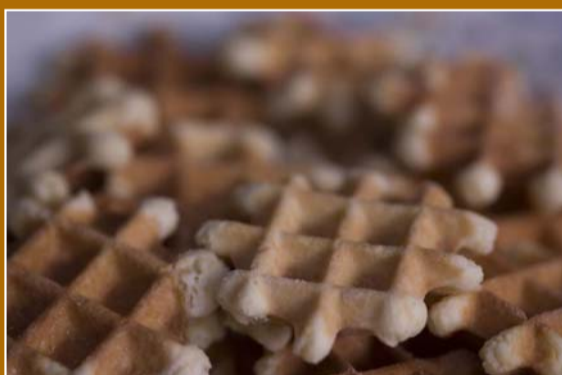
I canestrelli, dolci di Vaie, elemento di spicco del Paniere dei Prodotti tipici della Valle di Susa e della Provincia di Torino.

La festa dedicata al Santo (12 maggio) è oggi occasione per celebrare e gustare il prodotto più tipico del paese: il dolce canestrello. Dalle pendici boschive che la sovrastano, Vaie attinge inoltre una risorsa preziosa: l'acqua. La sorgente del Penturetto, posta a 650 metri di quota, alimenta diverse fontane che conservano intatta la sua leggerezza e qualità.