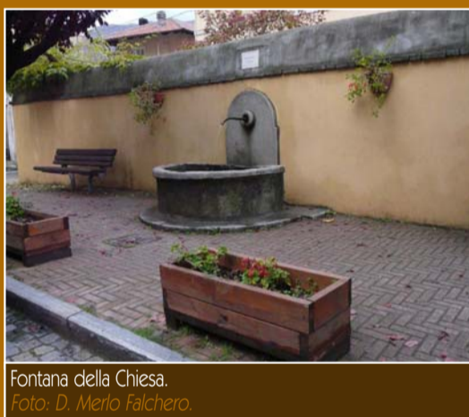
Fontana della Chiesa.