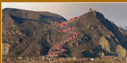
Lo sviluppo della malattiera sul versante est del Monte Pirchiriano. Elaborazione: E.Gillo.