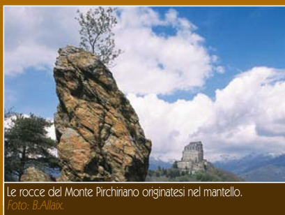
Le rocce del Monte Pirchiriano originatesi nel mantello.