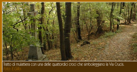
Tratto di mulattiera con una delle quattordici croci che simboleggiano la Via Crucis.