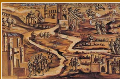
La Sacra di San Michele (in alto) rappresentata lungo la via Franchigena che consentiva il pellegrinaggio dalla Francia e dall'Inghilterra sino alla Terra Santa. Dipinto: G.Saus, coro vecchio della Sacra di San Michele.