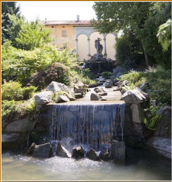
Scorcio monumentale del parco.