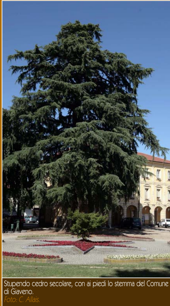
Stupendo cedro secolare, con ai piedi lo stemma del Comune di Giaveno.