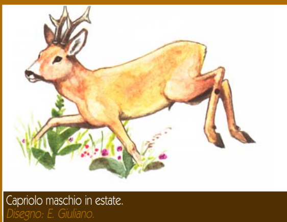
Capriolo maschio in estate. Disegno: E. Giuliano.

Tradiscono la sua presenza escrementi e "fregoni", dovuti allo sfregamento dei palchi su arbusti e alberelli. Se spaventati, i caprioli fuggono precipitosamente nel bosco, emettendo un "abbaio" molto simile a quello del cane.