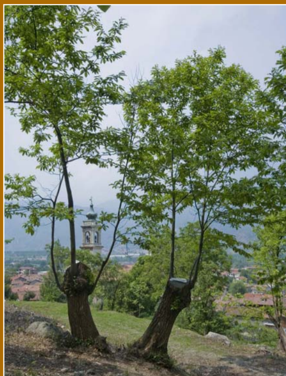
I castagni, un elemento tipico del paesaggio di Chiusa San Michele.