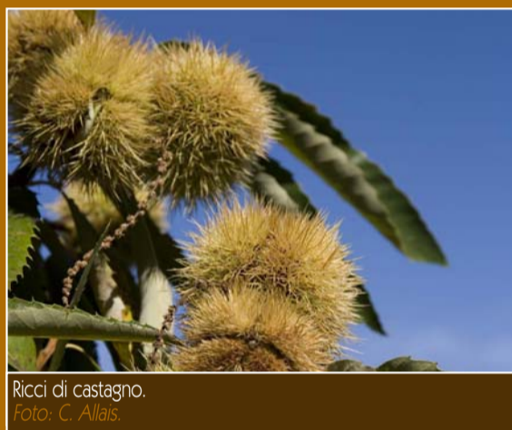
Ricci di castagno.

Territorio di bosco ceduo e rocce, anticamente la Bosonera era chiamata "Montagna Vicinosa", di proprietà della Sacra che ne permetteva l'uso ai clusini dietro compenso di 12 galline all'anno! Dal 1637 la gestione passa al Comune che organizza il taglio della legna con aste pubbliche, riservando una parte dei terreni alla popolazione più povera (il cosiddetto "fogaggio"). A partire dal 1778 l'area viene destinata a castagneto, preziosa fonte di sussistenza. Altro sito simile è quello chiamato "Pra do Det", dove sgorga l'ottima sorgente "Fontan-a do fra" (fontana del frate), punto sosta per il pic-nic. Nel 1753 già si producevano a Chiusa circa