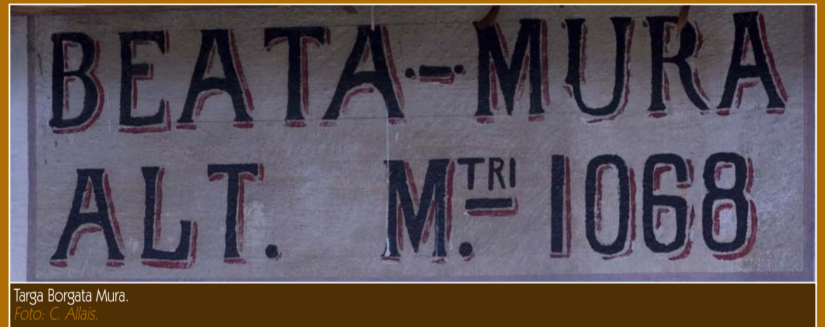
Targa Borgata Mura.