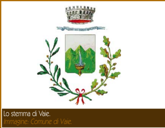
Lo stemma di Vaie. Immagine: Comune di Vaie.