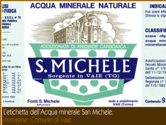
L'etichetta dell'Acqua minerale San Michele.

L'acqua è per Vaie un bene tanto prezioso da essere immortalata nello stemma comunale, dove si legge "dal cuore del monte donò vita". L'ottima qualità delle sorgenti è dovuta a falde acquifere che scorrono all'interno di gneiss (rocce metamorfiche derivanti da antichi graniti). Ne deriva un'acqua con poche sostanze in soluzione dunque leggera e gradevole; inoltre, la profondità delle falde garantisce una portata pressoché costante alle sorgenti.