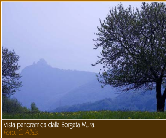
Vista panoramica dalla Borgata Mura.

Anche Carlo Magno potrebbe essersi dissetato alle sorgenti di Vaie! Si ritiene infatti che nel 773 l'esercito franco, per superare la resistenza opposta dai Longobardi alle "Chiuse", abbia risalito il versante passando proprio da qui. Valicato lo spartiacque con la Val Sangone, i Franchi aggirarono così il nemico sconfiggendolo. All'impresa è intitolato il "Sentiero dei Franchi".