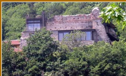
Prospecto Nord. Vista dall'abitato di Sant'Ambrogio di Torino del Castello Abbaziale restaurato con la struttura ricettiva ultimata.