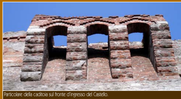
Particolare della caditoia sul fronte d'ingresso del Castello.