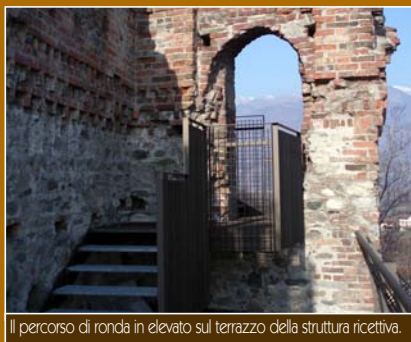
Il percorso di ronda in elevato sul terrazzo della struttura ricettiva.

LA STORIA. I resti del Castello abbaziale di Sant'Ambrogio documentano un avamposto di difesa e protezione per l'accesso alla Sacra e dimora urbana dell'Abate per l'esercizio della giustizia sui territori abbaziali. L'impianto originario risale al 1176, cui seguirono momenti di splendore con il rinforzo delle mura nel 1263, l'aggiunta della bertesca e delle caditoie piombanti nel 1368 e la decadenza, con numerosi saccheggi, fino alla sua definitiva distruzione nel 1706, ad opera delle truppe francesi che assediavano Torino.