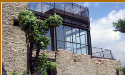
Prospecto Est. Vista delle murature recuperate con inserimento della nuova struttura in acciaio e vetro.