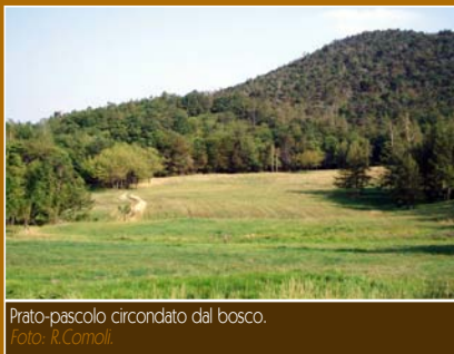
Prato-pascolo circondato dal bosco.