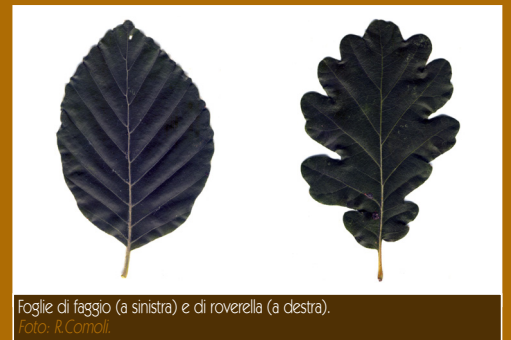
Foglie di faggio (a sinistra) e di roverella (a destra).