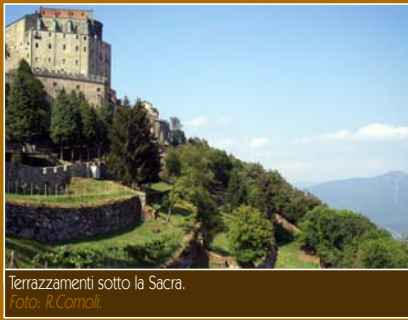
Terrazamenti sotto la Sacra.

LA SUCCESSIONE NATURALE SUL MONTE PIRCHIRIANO