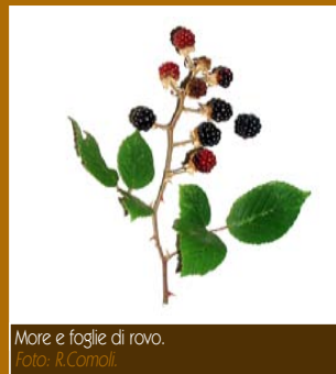
More e foglie di rovo.

Ora, prova a usare l'immaginazione. Cosa accadrebbe se l'uomo smettesse di coltivare i prati? Giungerebbero i primi colonizzatori, come i rovi ( Rubus spp. ), che producono le gustose more, e le rose selvatiche ( Rosa spp. ). Lentamente, nel corso degli anni, il paesaggio cambierebbe, in una successione di erbe, arbusti, alberi diversi, fino a raggiungere una fase finale di stabilità. Qui, sul Monte Pirchiriano, questa fase ultima è il bosco misto di latifoglie, dominato da maestosi faggi ( Fagus sylvatica ) o frugali roverelle ( Quercus pubescens ), con un'enorme ricchezza di specie vegetali e animali.