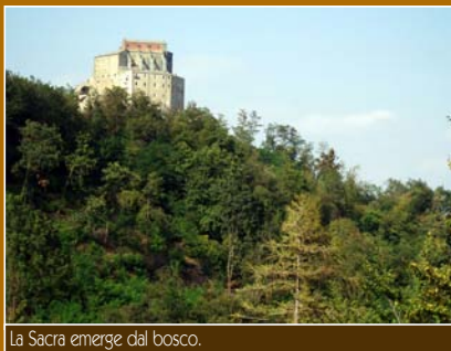
La Sacra emerge dal bosco.

In primavera, niente è più piacevole che sedersi fra l'erba fresca di un prato, verde e tenera, e rilassarsi fino a confondersi con la natura. In realtà, queste non sono praterie naturali, ma "coltivazioni di erbe", create dall'uomo con il taglio dei boschi nativi.