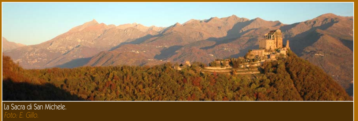
La Sacra di San Michele.

Il tratto precedente, da Giaveno alla Mortera, percorso dal corteo funebre di allora, ha invece perso tale indicazione; erroneamente la definizione di Strada dei Principi si è invece estesa al sentiero che scende verso la Borgata Bertassi.