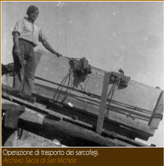
Operazione di trasporto dei sarcofagi.

È la notte del 25 ottobre 1836: un singolare corteo percorre la strada che da Giaveno, attraverso Borgata Sala, porta alla Mortera. Soldati, nobili, religiosi, inservienti di corte, semplici contadini portano e scortano 27 salme di defunti della famiglia Savoia. Il corteo funebre è diretto alla Sacra di San Michele.