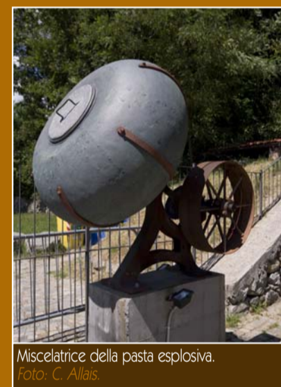
Miscelatrice della pasta esplosiva.