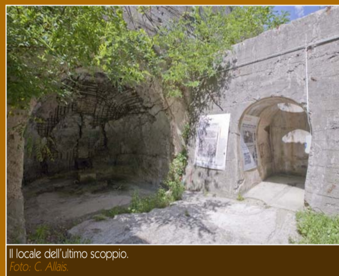
Il locale dell'ultimo scoppio.