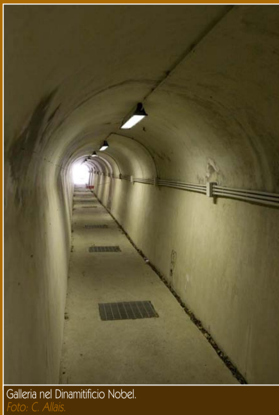
Galleria nel Dinamificio Nobel.

In quest'area, il 24 ottobre 1872, veniva autorizzata la realizzazione della fabbrica di dinamite "Nobel". A fine 1893 l'area occupava 200mila m 2 con 800 operai: un vero successo economico ed occupazionale per tutto il territorio. La pericolosità delle lavorazioni comportò tuttavia numerosi incidenti: nel corso della storia dello stabilimento si conteranno 91 morti sul lavoro di cui ben 22 nel solo 1890.