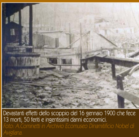
Devastanti effetti dello scoppio del 16 gennaio 1900 che fece 13 morti, 50 feriti e ingentissimi danni economici.

Percorrendo via Pietra Piana in direzione del Parco Naturale dei Laghi di Avigliana, si possono scorgere, seminascondi tra la vegetazione, diversi edifici risalenti all'originario complesso industriale. Al suo posto oggi sorgono diverse altre realtà produttive, perpetuando quella tradizione industriale che vide gli albori alla fine del XIX secolo, in un intrecciarsi continuo di vicende economiche e sociali.