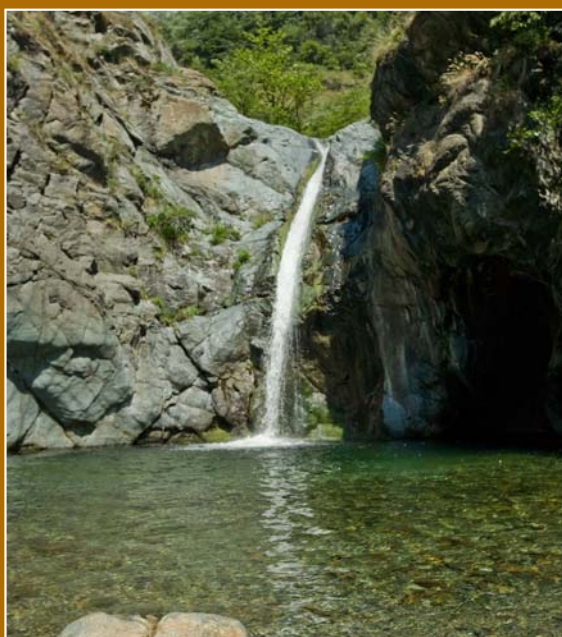
La Goja del Pis.