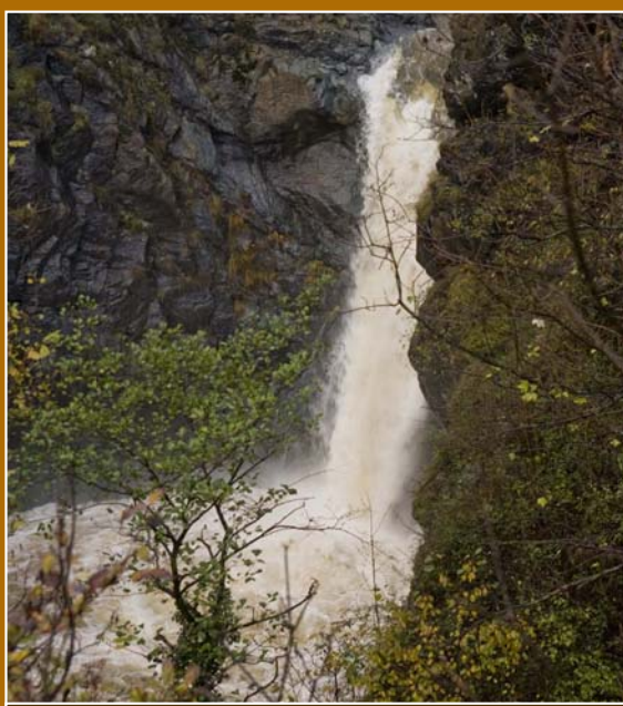
Il Torrente Messa in piena alla Goja del Pis.

Circondata da ripidi versanti, la conca di Almesese ospita l'ampio conoide alluvionale del Torrente Messa, costituito da ghiaie e sabbie, effetto di inondazioni susseguitesi dalle glaciazioni ai giorni nostri.