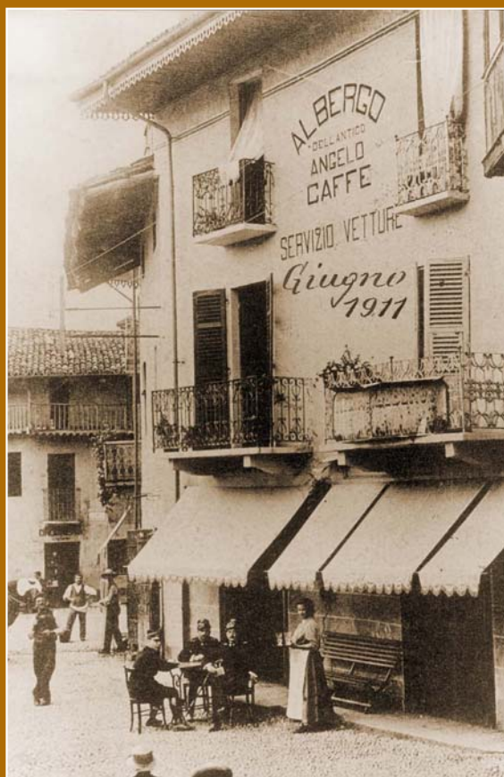
Piazza Martiri in una foto del 1911.

Già presente nell'Età del Ferro, Almese è stata testimone di molte vicende legate alla sua posizione, lungo la strada di Francia. Dal regno longobardo (VI secolo) a quello franco (VIII secolo), possesso dei Marchesi Arduinici e dell'Abbazia di S. Giusto di Susa (dal XI secolo), Almese si è trasformata in un importante centro per l'industria del ferro estratto nella vicina Rubiana e per il commercio con le Valli di Lanzo.