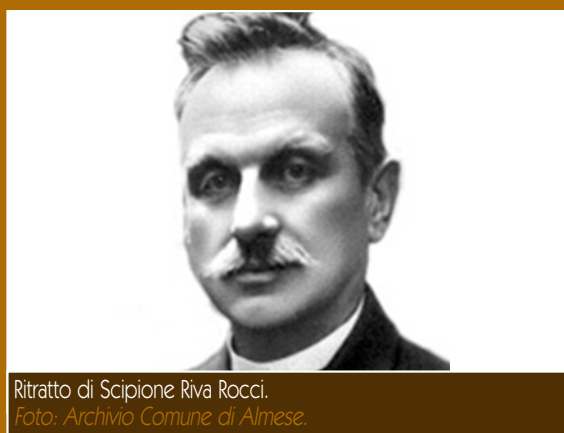
Ritratto di Scipione Riva Rocci.

Tra i personaggi illustri di Almese ricordiamo il medico Scipione Riva Rocci (1863-1937), pioniere nella lotta contro la tubercolosi e ideatore dello sfigmomanometro , misuratore della pressione arteriosa. Altro personaggio illustre fu Anna Michelotti (1843-1888), fondatrice delle Piccole Serve del Sacro Cuore di Gesù per l'assistenza dei malati poveri, proclamata Beata da Papa Paolo VI nel 1975.