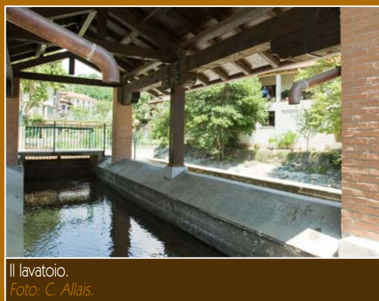
Il lavatoio.