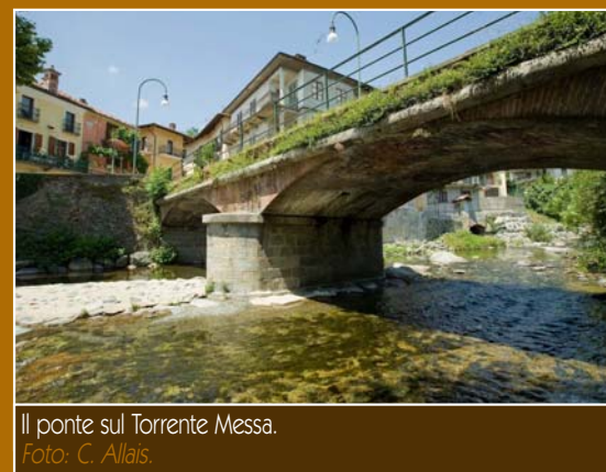
Il ponte sul Torrente Messa.